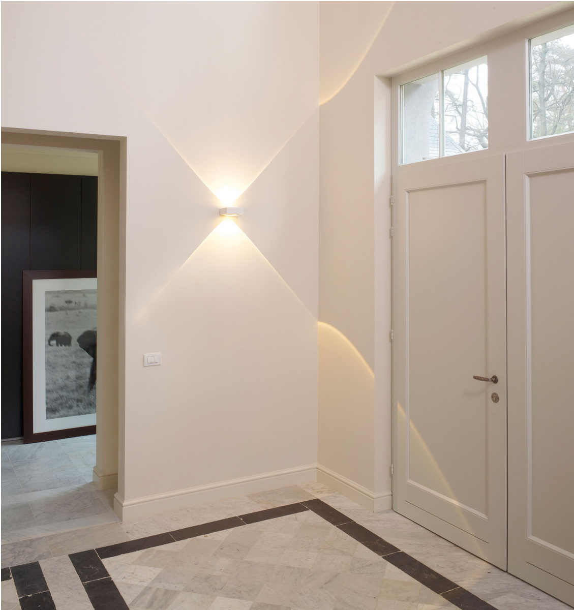
Imagen del proyecto